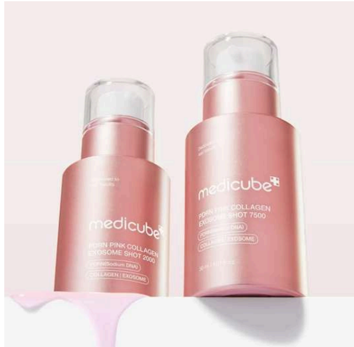
「塗るサーモン注射」

「塗るサーモン注射」「塗るエクソソーム針」など、医療的イメージを先取りした商品開発