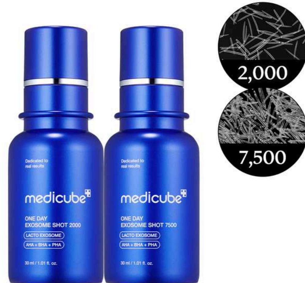
「塗るエクソソーム針」